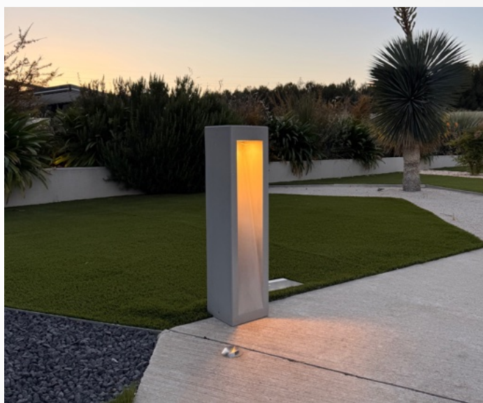
TABLEAU DE REFERENCES COMMANDES: EX: ONIX380/830