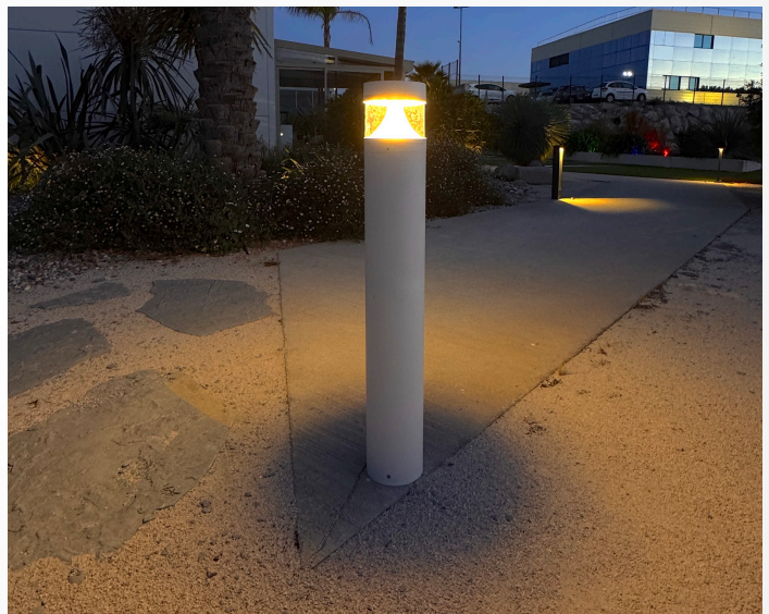
TABLEAU DE REFERENCES COMMANDES: EX: BOLA25-N/830